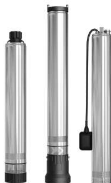
OLA OLA AUTO OLA INOX